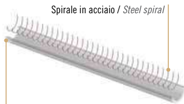
Spirale in acciaio / Steel spiral

Idoneo al trasporto di alimenti secondo il regolamento Europeo UE 10/2011 (classi A, B, C, D1) e secondo FDA Regulations CFR 21 (Parts 176.170).